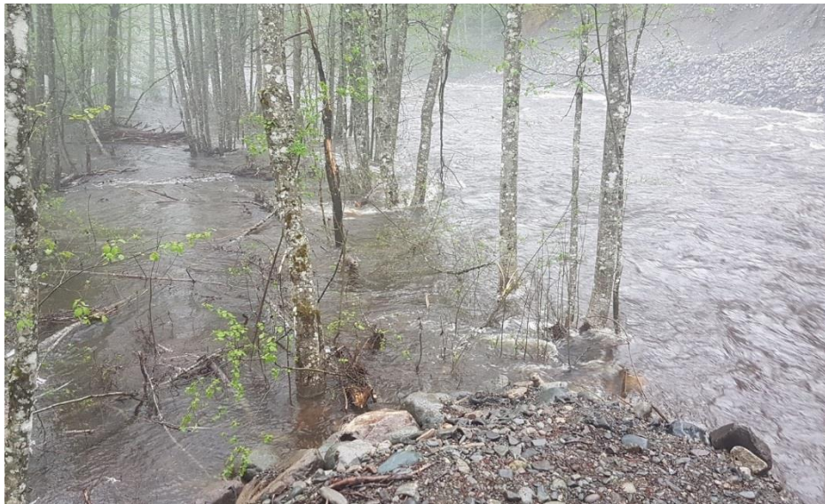
Bilete 7: Flaum Dalaåi, foto Tarjei Draugedal

Kommunen må vere rusta til å møte kriser av forskjellig storleik og konsekvens; frå ras og ureining, skogbrann, svikt i straumforsyning til pandemi og større ulykker. Kommunen må også ta høgde for å takle situasjonar som har oppstått som følge av ekstremver.