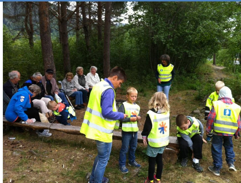
Aktivitetsdag i Ågapet

Samfunnsdelen som heilskap skildrar fleire mål og tiltak som dreier seg om folkehelse. Arbeidet vidare blir å utvikle ein eigen handlingsplan for folkehelsearbeidet i Kviteseid, noko som krev ein grundigare gjennomgang og oversikt over helsetilstanden på kommunenivå. Like viktig som å identifisere negative påverknadsfaktorar og utfordringar, er å sjå på dei ressursane som påverkar helse i eit lokalsamfunn. I Kviteseid er natur og friområde lett tilgjengeleg. Vi har eit rikt kultur- og idrettstilbod samt ei aktiv kyrkje, som gjev sosiale møteplassar. Alle desse ressursane er med på å gje eit godt grunnlag for folkehelsa i Kviteseid.