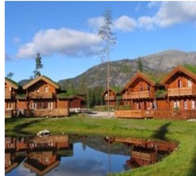
Bilete 10: Vrådal.

Utbygging av nye areal både til bustader og hytter gjev eit auka press på tilrettelegging av småbåthamner og det er liten/ingen kapasitet i dei eksisterande båthamnene i kommunen. Då båtplass og tilgang til vatn er viktig for mange av dei som ynskjer fritidsbustad i Kviteseid må det opnast for utviding av eksisterande småbåthamner og etablering av nye.