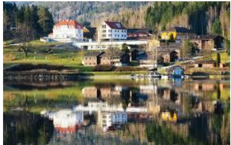
Bilete 2:Kvitsund

I tillegg til Kvitsund er Vest-Telemark vidaregåande skule viktig for Kviteseid.