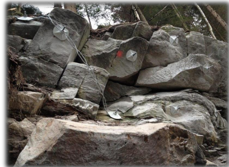
Bilete 8: Rassikring.

Kompetanse og planverk må tilpassast nye krav, overordna risiko- og sårbarheitsanalysar (ROS-analysar) må gjennomførast, og samfunnstryggleik må få ein brei plass i areal- og verksemdsplanar. Dei siste åra har vi opplevd større flaum enn tidlegare, noko som stiller større krav til konsekvensutgreiingar og at ein unngår nybygging i fareområde. Det betyr at i åra som kjem vil tilpassing og oppdatering av planverk, kompetansehevingstiltak, øvingar og samarbeid med andre instansar, og investering i sikringstiltak ha eit særskilt fokus.