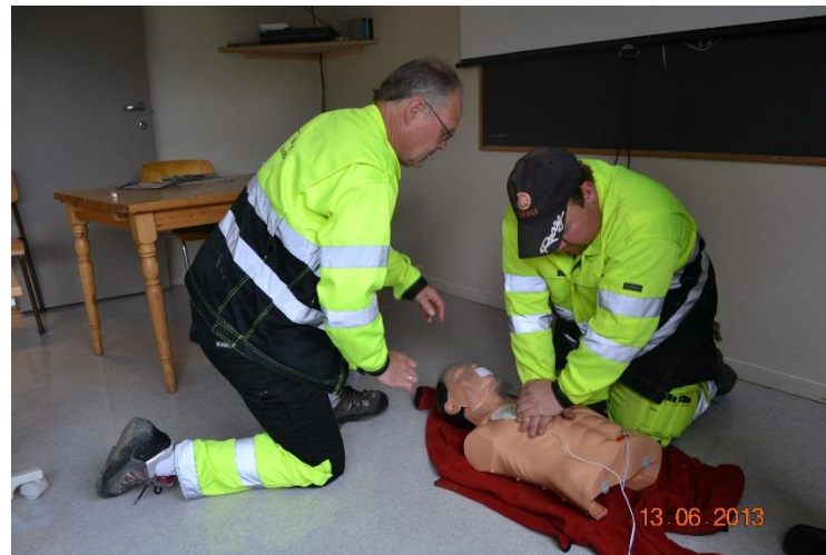
Folkehelse – Teknisk øver på førstehjelp